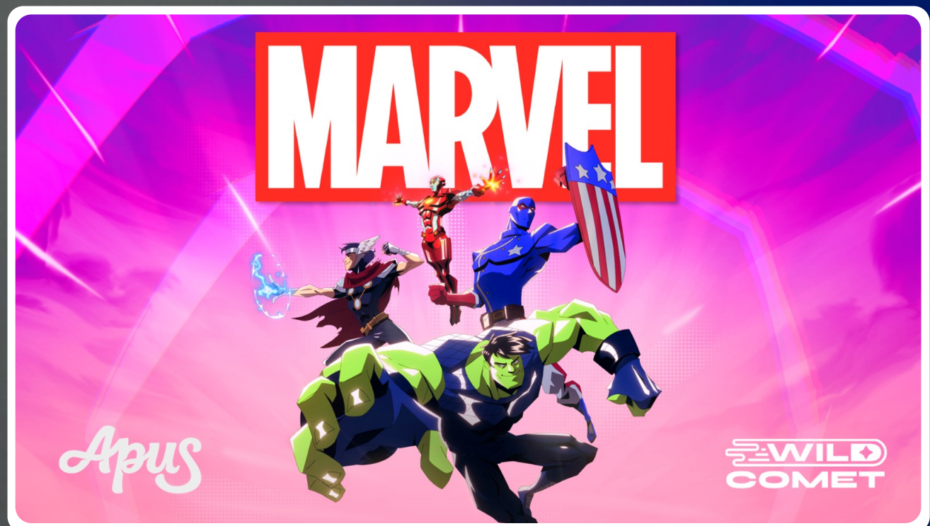
Young Avengers "Today in Marvel History". (2025)