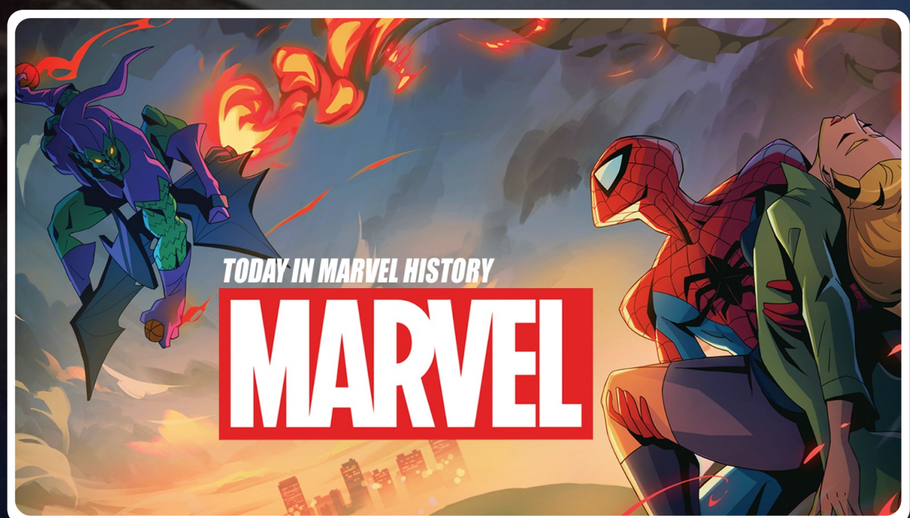
The Death of Gwen Stacy "Today in Marvel History". (2025)